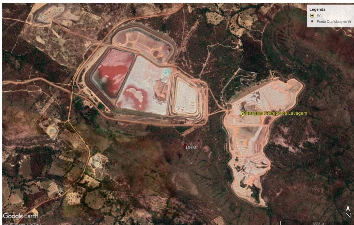
Figura 4. 1. Localização do ponto de monitoramento da qualidade do DRM