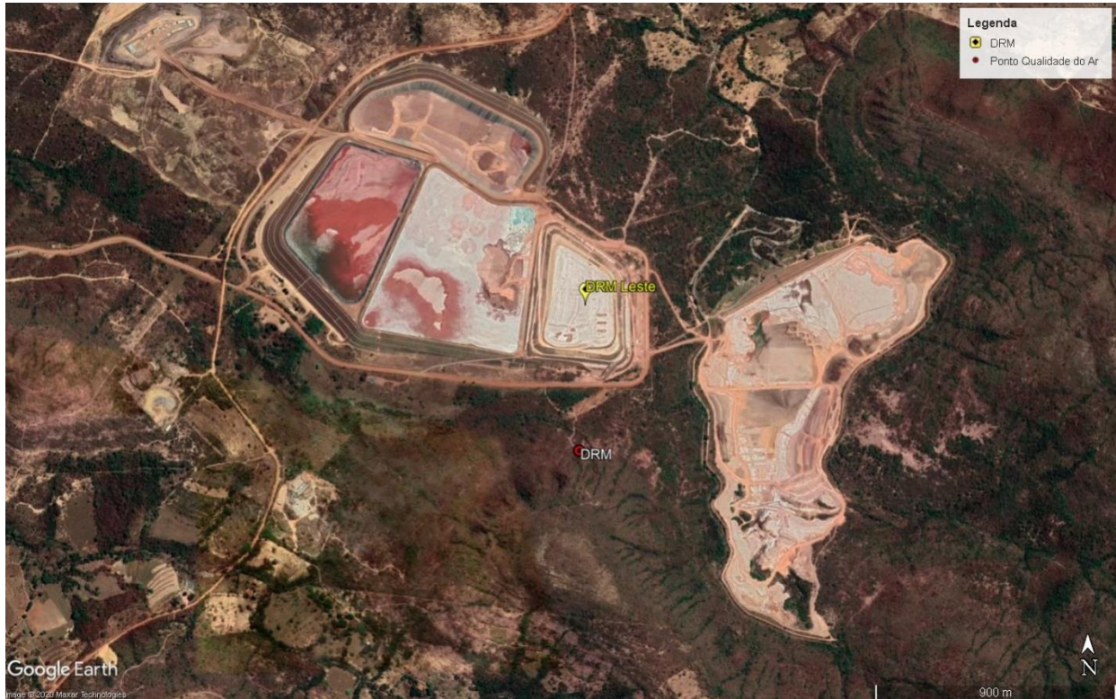
Figura 4. 1. Localização do ponto de monitoramento da qualidade do ar do DRM