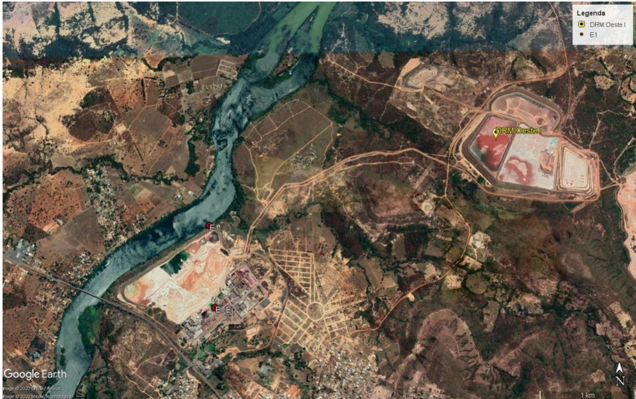
Figura 4. 1. Localização do Módulo Oeste 1 do DRM